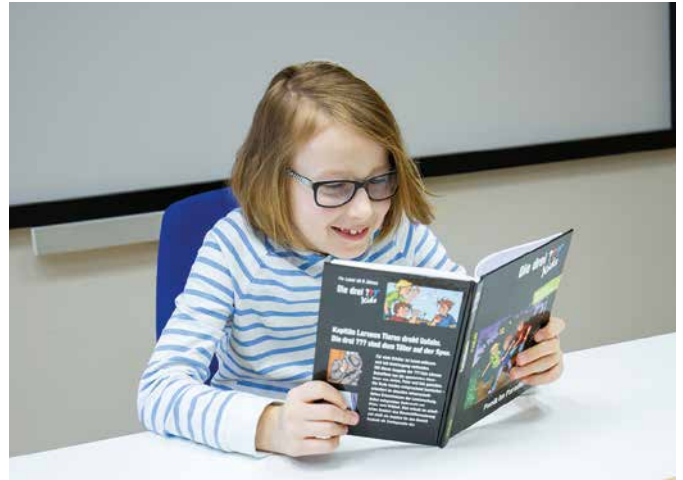
Bei Leseförderbüchern sollte das äußere Erscheinungsbild eng an das Original angelehnt sein.