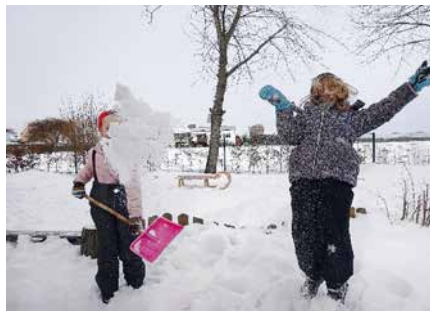
Winterspaß im Garten bei der „ABC“ Gruppe