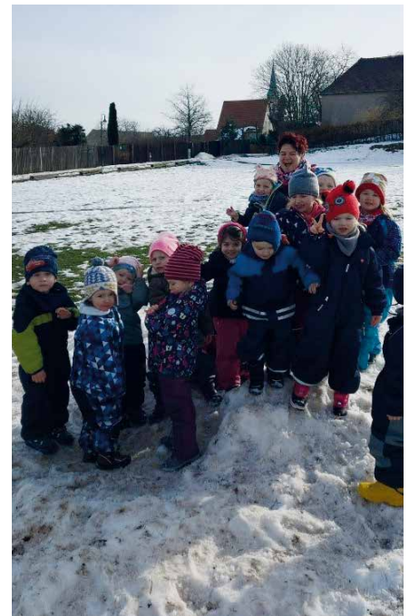
„Schlaue Füchse“ toben auf dem Sportplatz