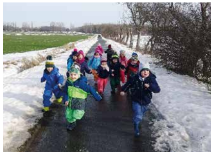
„Regenbogenkinder“ beim Ausflug