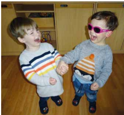
Wiedersehen bei den „Mäusen“